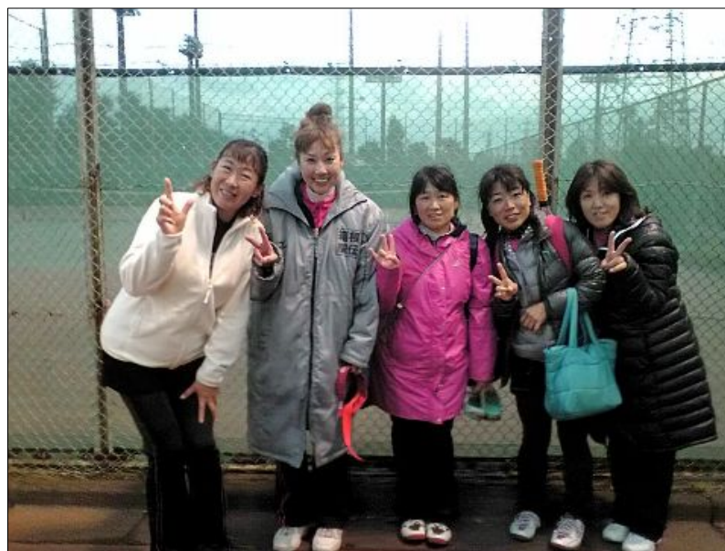
敢闘賞 エンジェルス