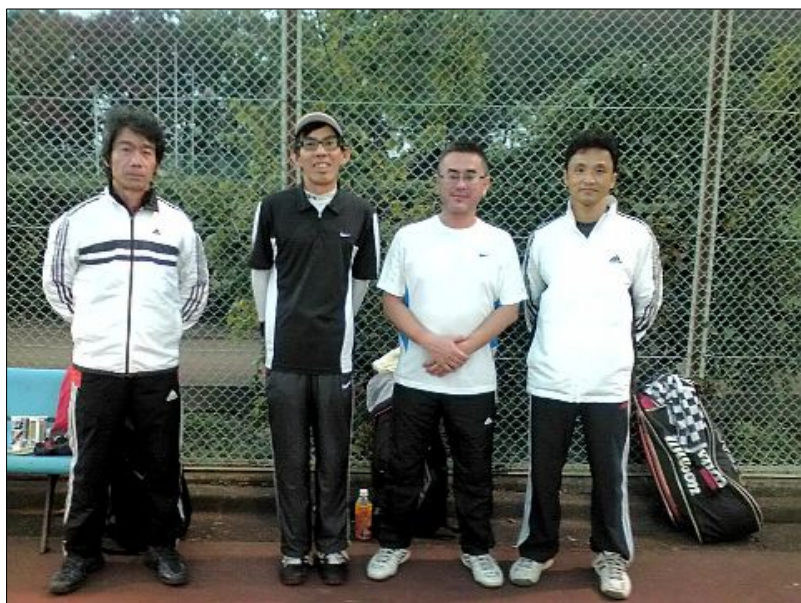
第三位 GTT A