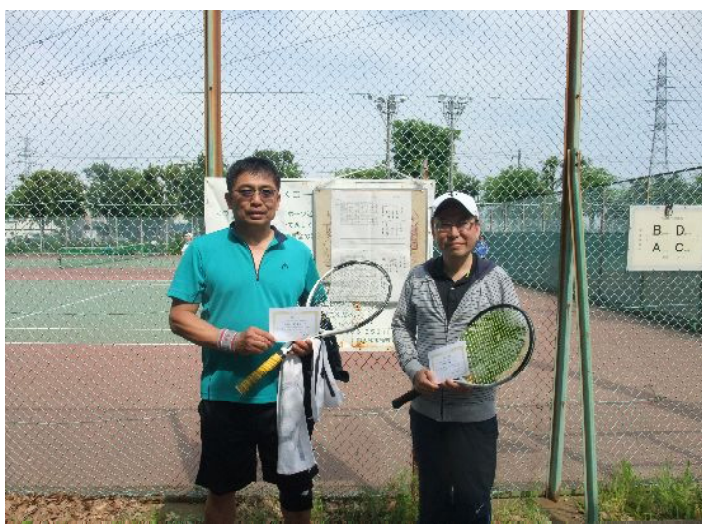
第3位 上原・吉岡組