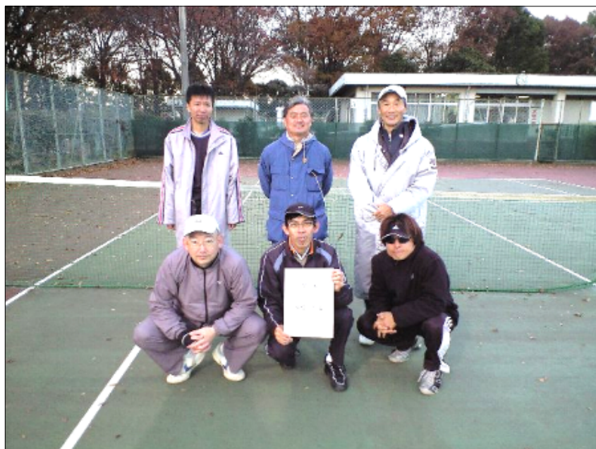
第3位 GTT A