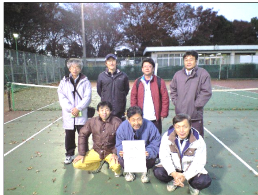
準優勝 TOA DKK