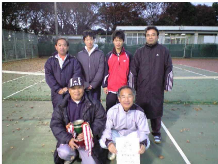
優勝 CASIO PPR