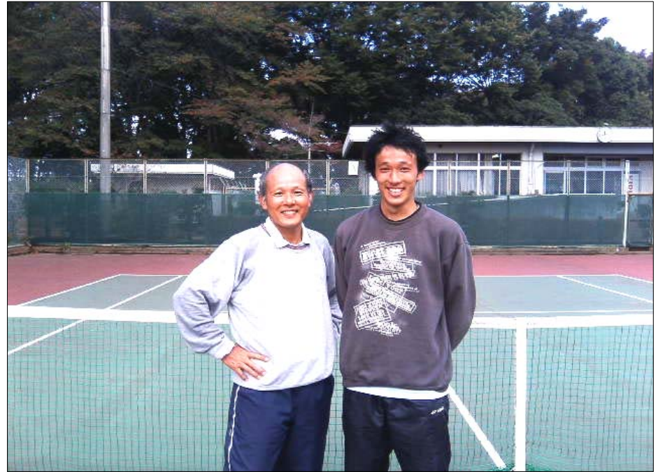
準優勝／笹子・笹子